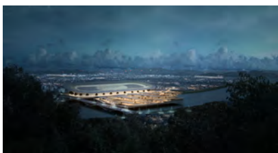
PARADOX OF INDUSTRIAL CITIES / IRON NATURE AGRICULTURAL REVOLUTION 3.0(FUKUYAMA CITY) 地方行政における都市の全体構想