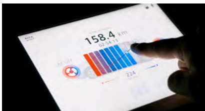
DEVELOPMENT 3 SOFTWARE Designed by ON Management HISTORY OF LESS,ZERO PRODUCT SUPER DIRECTLY (DAIWA HOUSE Group) ソフトウェアのコンセプト設計、UXUI、デザインディレクション

尚、現在進行しておりますプロジェクトにつきましては、引き続き人員体制をより強固にし、更に質を上げて邁進する所存でございますので、何卒宜しくお願い致します。