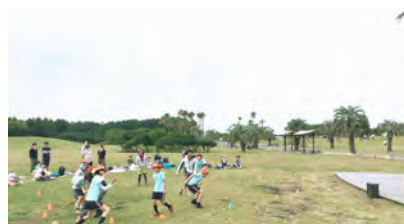
GRADATIONISM INCLUSIVE EDUCATION(N.I.S.) 教育における基礎概念の立案および教育機関の設立