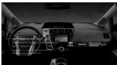
INFOGRATION "MOVEMENT FOLLOWS THE INFORMATION"(TOYOTA) 未来におけるモビリティのリサーチプロジェクト